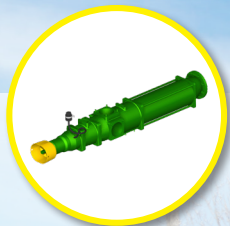
Pompa ślimakowa 4500 l/min