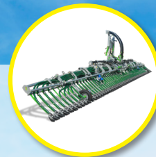
Rampa 15 m Pendislide PRO 150/60PS2